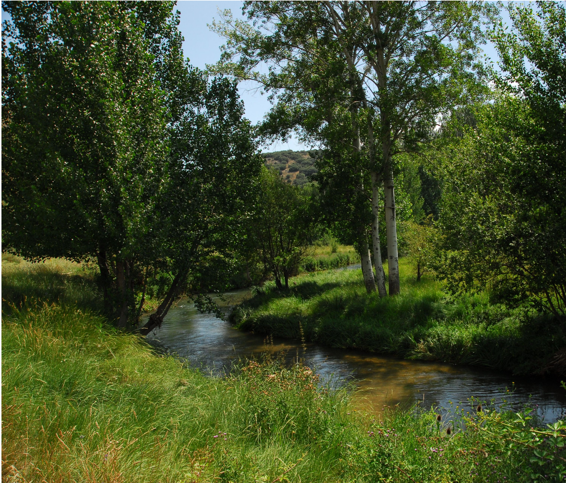
Foto: Reserva natural fluvial en el Río Guadalaviar en Albarracín

La declaración las reservas naturales fluviales tiene como finalidad preservar, sin alteraciones, aquellos tramos de ríos con escasa o nula intervención humana.